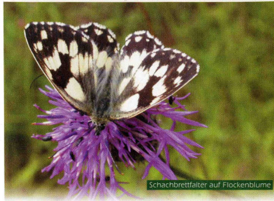
Schachbrettfalter auf Flockenblume