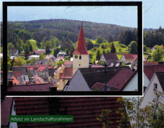
Alfeld im Landschaftsrahmen

Und danach finden Sie in Alfeld fränkisch-gemütliche Gastlichkeit.