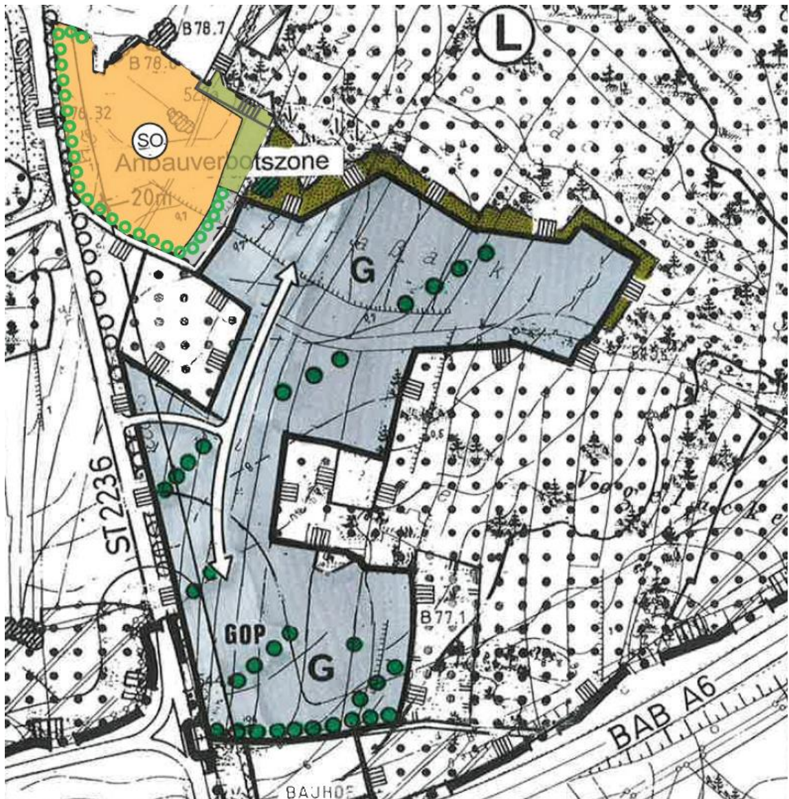
Abb.: Wirksamer Flächennutzungsplan (Zusammenschau 1. und 3. Änderung).

Die Baufläche gemäß vorliegendem Bebauungsplan ist kleiner als die im Flächennutzungsplan dargestellte gewerbliche Baufläche. Im östlichen Teil des Geltungsbereichs des Bebauungsplanes wird eine gemäß Flächennutzungsplan als gewerbliche Baufläche dargestellte Fläche stattdessen als Ausgleichsfläche festgesetzt. Dies erfolgt aus Gründen des Natur- und Landschaftsschutzes, insbesondere um Pufferzonen zu den angrenzenden Waldbeständen zu erhalten (vgl. Kapitel 4.5).