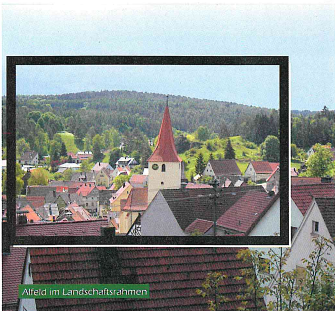
Alfeld im Landschaftsrahmen

Und danach finden Sie in Alfeld fränkisch-gemütliche Gastlichkeit.