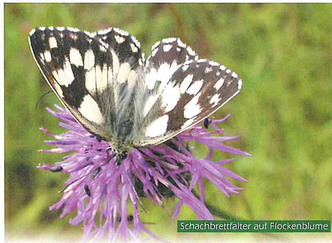
Schachbrettfalter auf Flockenblume