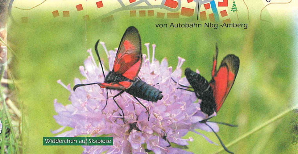
Widderchen auf Skabiose